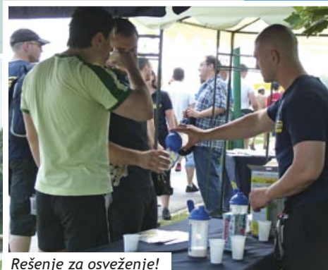
Rešenje za osveženje!